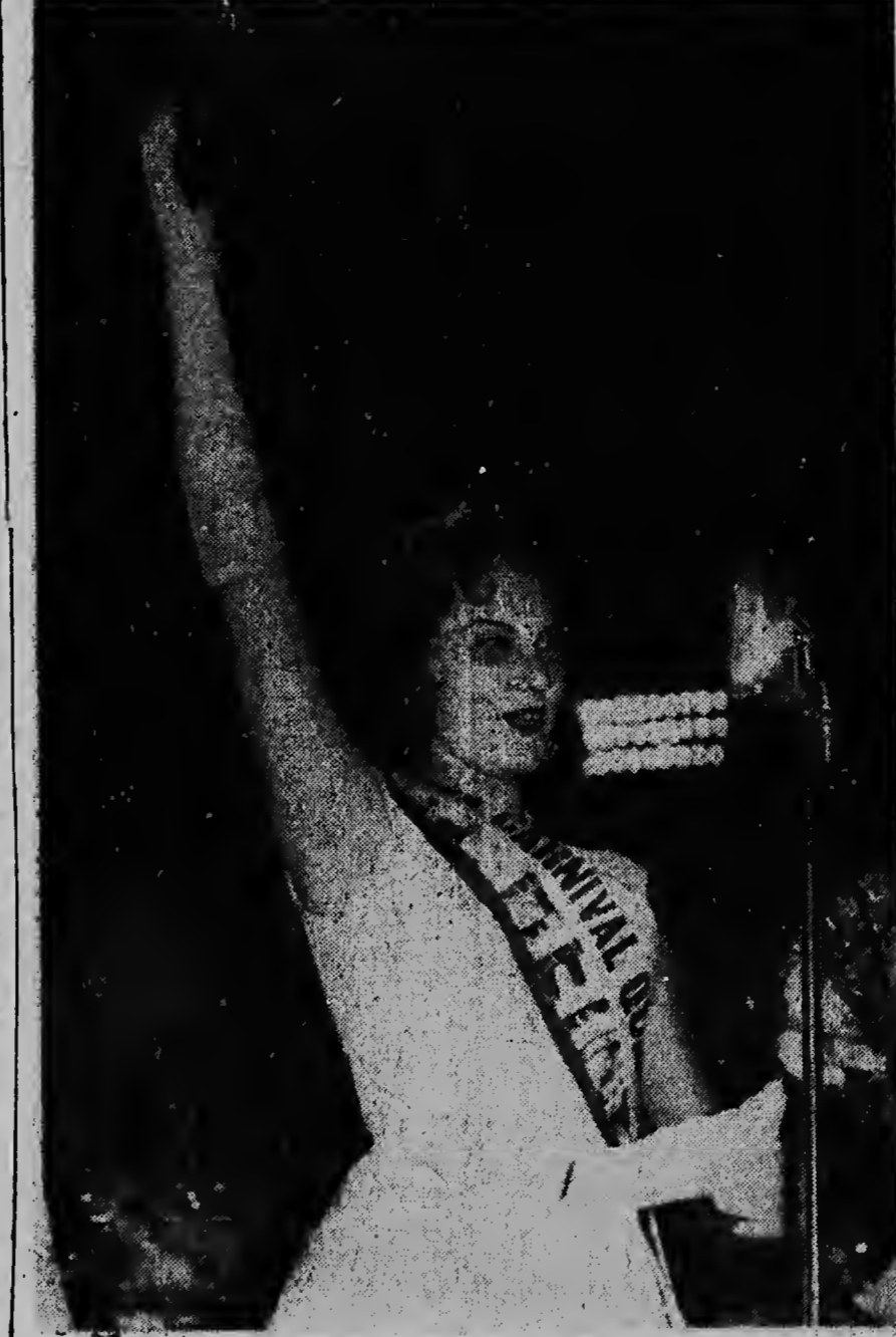
Ta riba dje ta recel e honor awe noch di worde corona como Reina di Carnaval di Aruba den Wilhelmina Stadion.